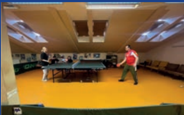
TURNAJ VE STOLNÍM TENISE