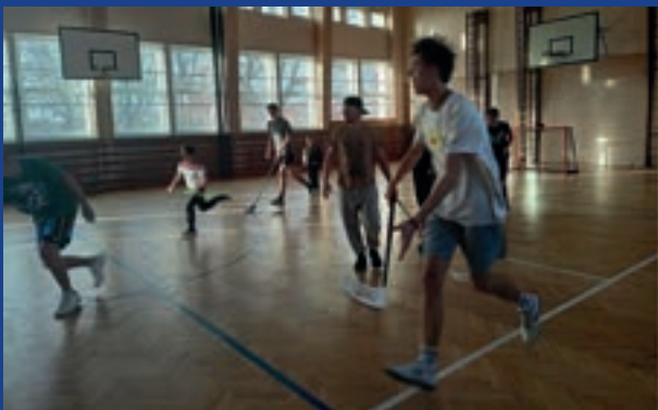
TURNAJ VE FLORBALE - FOTBALE