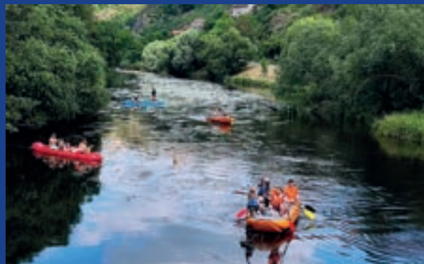
SJÍŽDĚNÍ ŘEKY DYJE

Pořádáme volnočasové akce pro náhradní rodiny a jejich přátele.