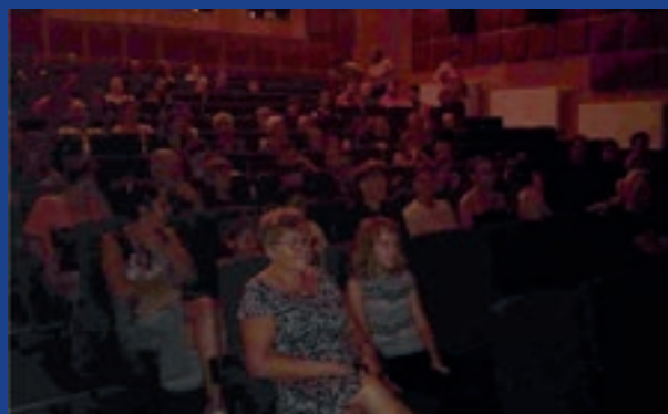
PROMÍTÁNÍ V KINĚ