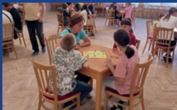
TURNAJ V ČLOVĚČE NEZLOB SE